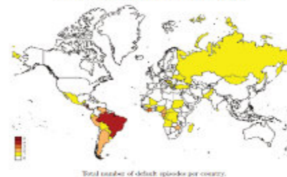
Figure 2. Distribution of Domestic Default Episodes

Wewnętrzne bankructwa krajów w latach 1980-2018. 2